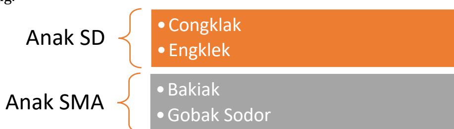
Gambar 1. Pembagian Jenis Permainan

Pada awalnya, kelompok relawan memilih jenis permainan yang akan dimainkan. Untuk anak-anak SD, mereka memilih Congklak dan Engklek, sedangkan untuk anak-anak SMA, mereka memilih Bakiak dan Gobak Sodor. Setelah itu, permainan tersebut dipublikasikan di media sosial. Selain itu, tim juga menyiapkan peralatan permainan untuk turnamen yang akan berlangsung di festival permainan adat. Peralatan ini dibuat dari bahan dasar yang dapat ditemukan secara lokal. Mereka juga membuat spanduk untuk lapangan hopscotch agar lebih menarik secara visual selama permainan berlangsung.