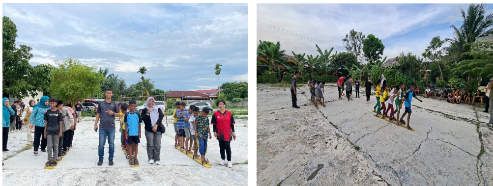
Gambar 2. Jumlah Siswa dalam Kegiatan