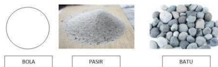
Gambar 5. Rancangan Modifikasi Tolak Peluru