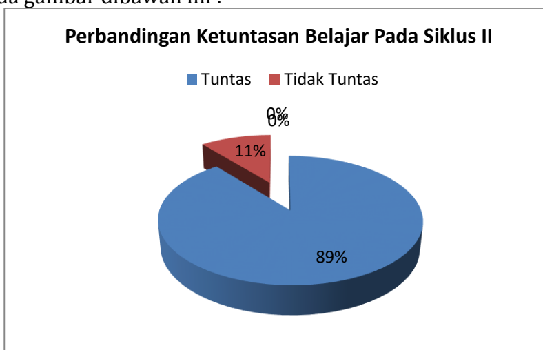
Gambar 2. Frekuensi Siklus II

Untuk mempermudah dalam melihat hasil belajar siswa dari siklus II secara visual dapat dilihat pada gambar dibawah ini :