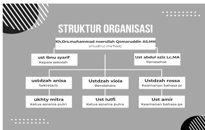
Gambar 3. Foto Struktur Organisasi Program Takhasus Ponpes Wali songo Lampung Utara