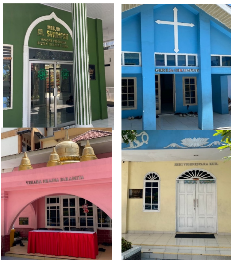
Gambar 2 Rumah Ibadah Masjid, Gereja, Vihara, dan Kuil

tidak hanya terbatas pada ruang kelas, tetapi juga tercermin dalam kebijakan sekolah, simbol fisik, serta kegiatan kurikuler dan ekstrakurikuler. Salah satu aspek paling menonjol adalah rumah ibadah seperti masjid, gereja, vihara, dan kuil yang dibangun secara berdampingan di lingkungan sekolah. Fasilitas ini tidak hanya berfungsi sebagai tempat ibadah, tetapi juga dimanfaatkan sebagai sarana edukasi lintas agama. Siswa diperkenankan untuk mengunjungi dan memahami ajaran masing-masing agama, menjadikan rumah ibadah tersebut sebagai wujud nyata praktik multikultural di sekolah.