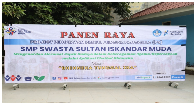
Gambar 4 Kegiatan P5 Panen Raya