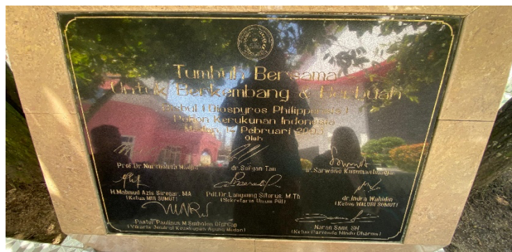
Gambar 3 Prasasti Peresmian Pohon Bisbul