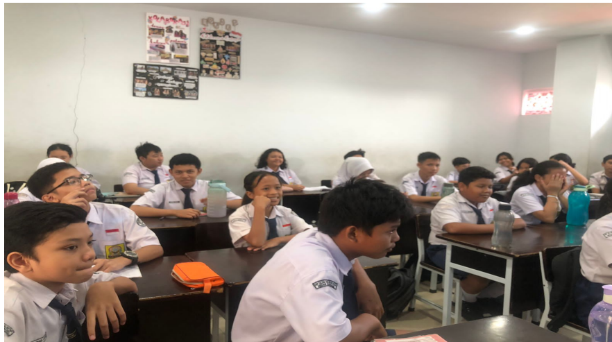
Gambar 1 Potret Keberagaman di Ruang Kelas