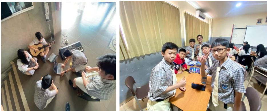
Gambar 2 Menyelesaikan boardgames serta berlatih alat musik bersama, Indikator Kerjasama

Peneliti: “Apakah pernah bekerjasama?dalam hal apa?” C.R: “Pernah, pas kemarin boardgames , terus ada juga kerja kelompok”.