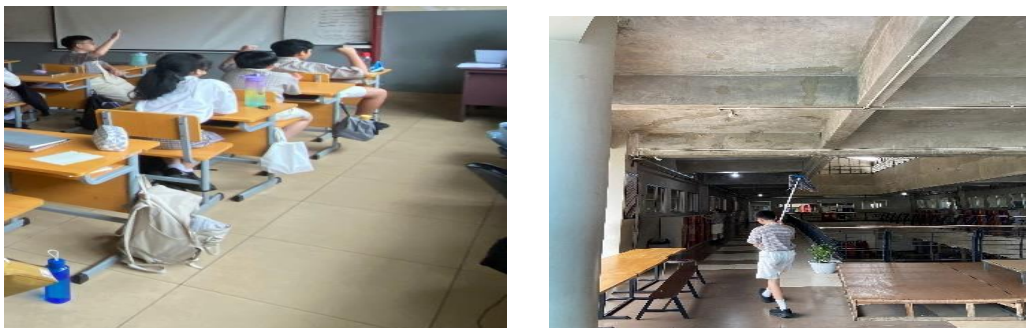
Gambar 5 Para peserta didik membawa tumbler air minum serta melaksanakan piket kelas, Indikator mencintai lingkungan

Berdasarkan observasi dan wawancara bersama peserta didik didapatkan hasil bahwa mengikuti character building juga semakin menunjukkan kesadaran akan pentingnya menjaga lingkungan sekolah dan sekitarnya. Dalam kegiatan seperti piket kelas, peserta didik secara aktif ikut berpartisipasi dan mengambil inisiatif untuk menjaga kebersihan. Selain itu, peserta didik juga mulai mengembangkan kebiasaan ramah lingkungan, seperti membuang sampah pada tempatnya dan membawa bekal dari rumah dan menggunakan tumbler botol air minum guna mengurangi penggunaan sampah plastik sebagai bentuk kepedulian dalam menjaga lingkungan sekolah khususnya dan lingkungan hidup secara umum.