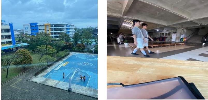
Gambar 4 Bermain bersama serta pergi ke kantin bersama

Gambar 4 peserta didik bermain bersama di lapangan serta ke kantin bersama, menunjukkan rasa persahabatan di lingkungan pendidikan, indikator persahabatan.