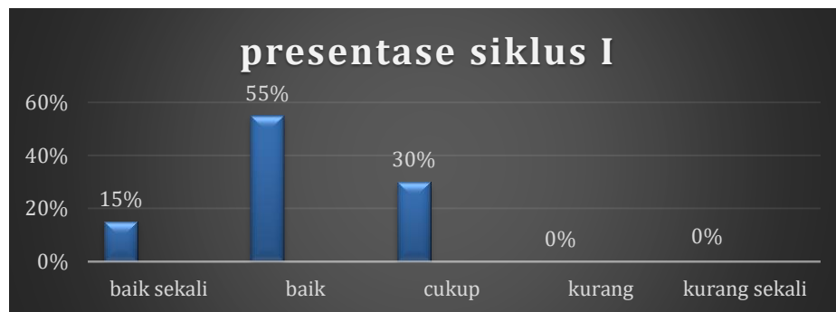
Grafik 2. Data presentase hasil belajar shooting siklus I

Lebih jelasnya berikut ini disajikan grafik data siklus I setelah di berikan pembelajaran shooting menggunakan punggung kaki dalam pembelajaran sepak bola melalui modifikasi gawang dengan media kardus pada peserta didik kelas V SDN 2 Nanga Beloh sebagai berikut: