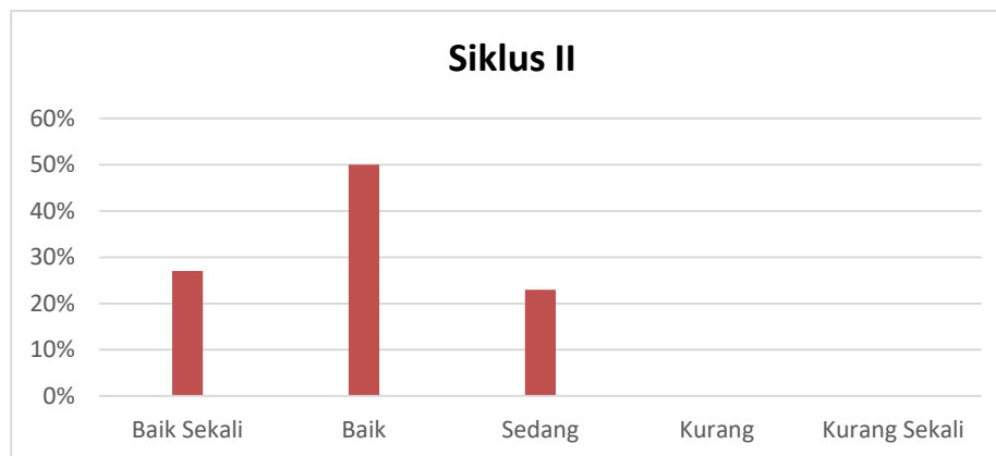
Gambar 3. Grafik Data Siklus II keterampilan dasar lari

Lebih jelasnya berikut ini disajikan grafik data siklus II setelah diberikan pembelajaran permainan tradisional dalam meningkatkan keterampilan gerak dasar lari pada peserta didik di SDN 17 Sungai Raya sebagai berikut: