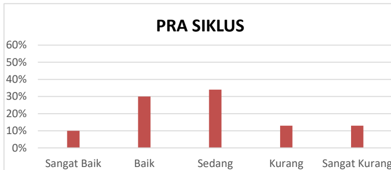
Gambar 1. Histogram data pra siklus keterampilan gerak dasar

Berdasarkan hasil deskripsi rekapitulasi data awal sebelum diberikan tindakan dapat dijelaskan bahwa siswa yang mencapai kerteria ketuntasan minimal (KKM) sebanyak 12 orang siswa atau 40%, dan yang kategori sedang sebanyak 10 siswa atau 34%, kategori kurang sebanyak 4 siswa atau 13% dan berkategori sangat kurang sebanyak 4 siswa atau 13%.