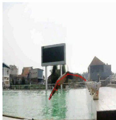
Gambar 2. Fase melayang/apswing