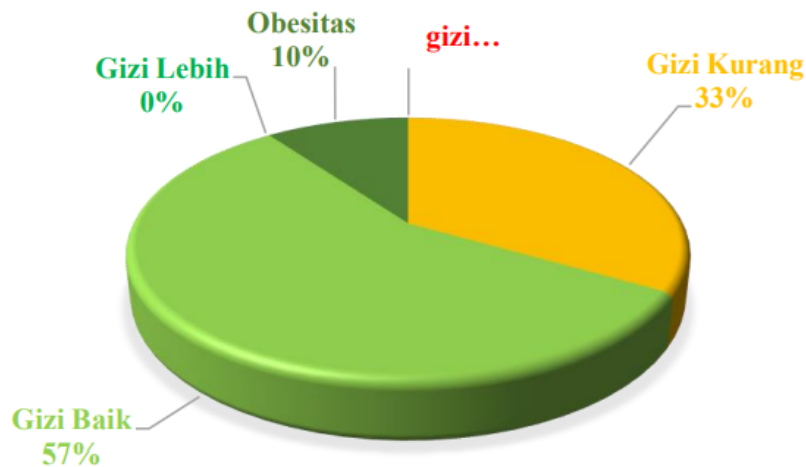
Gambar 1. Diagram pie status gizi siswa SSB Bukit Kemuning