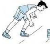
Gambar 2.5. Posisi saat aba-aba “Ya” Sumber : Syarifuddin (1992)

( http://www.brianmac.co.uk/sprints/starts diakses pada tanggal 15/4/2018)