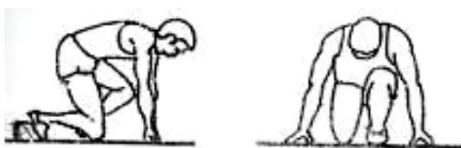
Gambar 2.2 start jongkok

Menurut Sidik, (2010:12) start jongkok dibagi dalam empat fase yaitu: (1) Posisi “Bersedia”, (2) Posisi “Siap”, (3) Gerakan dorong, dan (4) Lari Akselerasi. Dalam posisi “Bersedia” sprinter telah siap pada balok start dan mengambil sikap awal. Dalam posisi “Siap” sprinter bergerak ke posisi start secara optimal. Dalam fase “dorong” sprinter meninggalkan balok start dan melakukan langkah pertama lari. Dalam fase “lari percepatan” sprinter menambah kecepatan lari dan melakukan transisi ke gerakan lari.