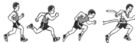
Gambar 2.6 Saat memasuki finish

Garis finish adalah garis akhir perlombaan dimana kecepatan maksimal sangat dibutuhkan saat memasuki garis tersebut dan bukan sebaliknya. Ada 3 macam teknik dalam memasuki garis finish, yaitu: (1) lari terus tanpa mengurangi kecepatan, (2) pada saat menyentuh pita, dada dicondongkan ke depan dan ayunan tangan ke belakang, (3) pada saat menyentuh pita, dada agak diputar dengan ayunan tangan ke depan. Aip Syarifudin (1992:13)