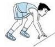
Gambar 2.4 Posisi saat aba-aba “Siap” Sumber : Syarifuddin (1992)

( http://www.brianmac.co.uk/sprints/starts diakses pada tanggal 15/4/2018)