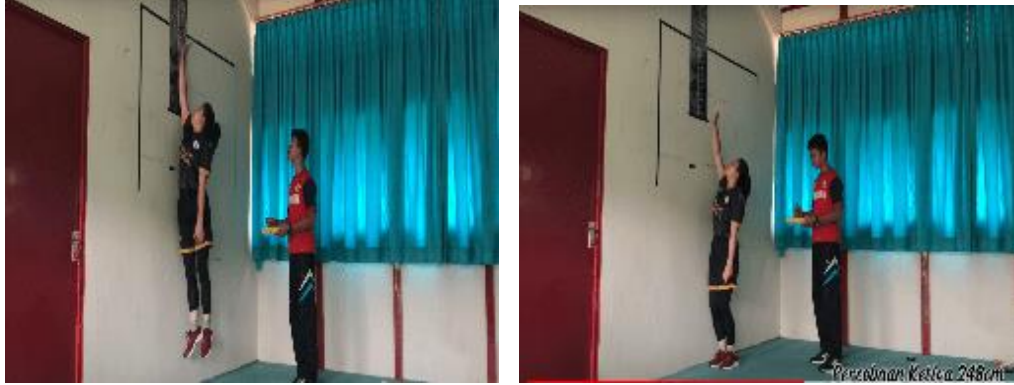
Gambar 15. Peserta Melakukan Tes Vertical Jump

Tes yang keempat adalah tes lari 1600 meter . Lari 1600 meter merupakan lari untuk mengukur daya tahan kardiovaskuler atau daya tahan jantung paru-paru. Cara pelaksanaannya peserta menyiapkan lokasi, menentukan menghitung ukuran tempat untuk melakukan lari. Misalkan di lapangan bola basket yang kita gunakan ukuran kelilingnya 80 meter, berarti jumlah jarak yang ditempuh sejauh 1600 meter perlu menentukan jumlah putaran atau keliling yang harus dilewati peserta. Jadi 1600 meter di bagi dengan jumlah 1 keliling 80 meter sama dengan 20 putaran. Artinya peserta harus melakukan lari sebanyak 20 putaran dengan waktu yang sesingkat-singkatnya.