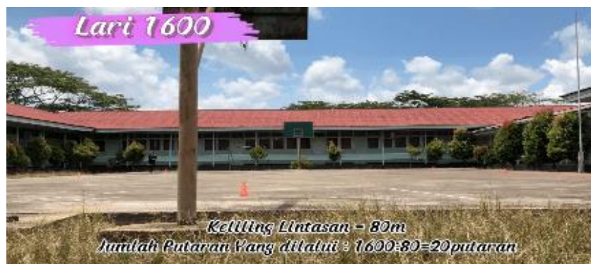
Gambar 16. Salah satu lokasi Lari 1600 meter

Tes yang keempat adalah tes lari 1600 meter . Lari 1600 meter merupakan lari untuk mengukur daya tahan kardiovaskuler atau daya tahan jantung paru-paru. Cara pelaksanaannya peserta menyiapkan lokasi, menentukan menghitung ukuran tempat untuk melakukan lari. Misalkan di lapangan bola basket yang kita gunakan ukuran kelilingnya 80 meter, berarti jumlah jarak yang ditempuh sejauh 1600 meter perlu menentukan jumlah putaran atau keliling yang harus dilewati peserta. Jadi 1600 meter di bagi dengan jumlah 1 keliling 80 meter sama dengan 20 putaran. Artinya peserta harus melakukan lari sebanyak 20 putaran dengan waktu yang sesingkat-singkatnya.