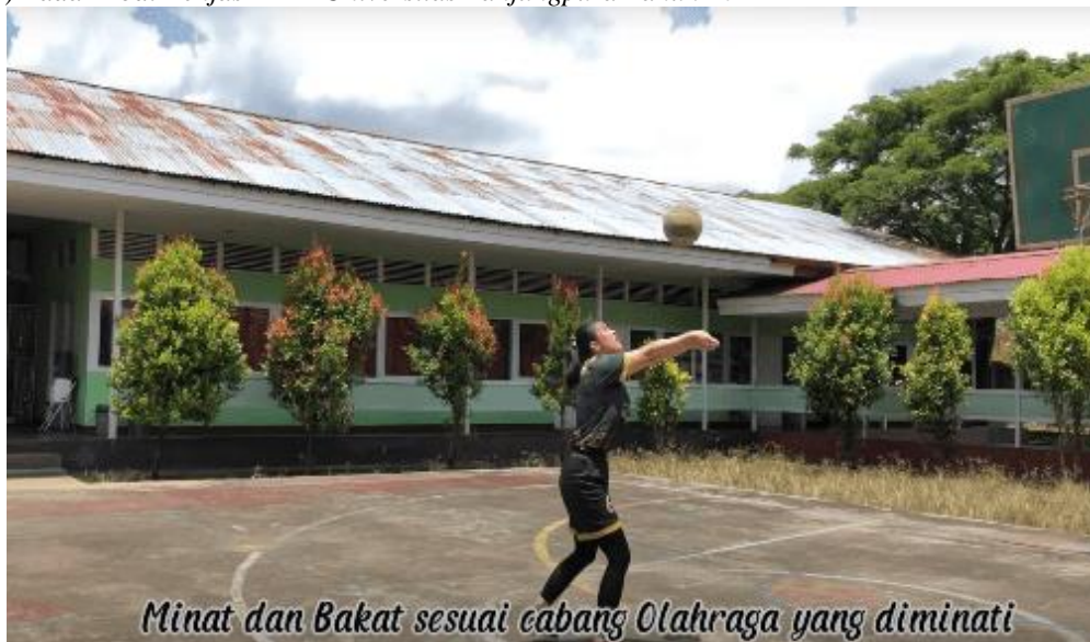
Gambar 17. Peserta melakukan praktek minat dan bakat cabang bola voli

Sosialisasi ini dilakukan agar permasalahan yaitu jumlah peminat yang semakin tahun semakin menurun. PKM yang dilakukan program studi pendidikan Jasmani FKIP Universitas Tanjungpura sebagai jawaban dari permasalahan yang timbul karena berbagai faktor. Berawal dari kurang pemahaman siswa maupun guru dalam melaksanakan portofolio keterampilan jasmani, belum dilaksanakannya sosialisasi tentang tes keterampilan olahraga pada SNMPTN dan SBMPTN di Kalimantan Barat. Maka berdasarkan hasil PKM yang sudah dilaksanakan ini, sangat membantu siswa, guru, orang tua, dosen dan pihak sekolah dalam memahami tahap-tahap tes keterampilan olahraga.