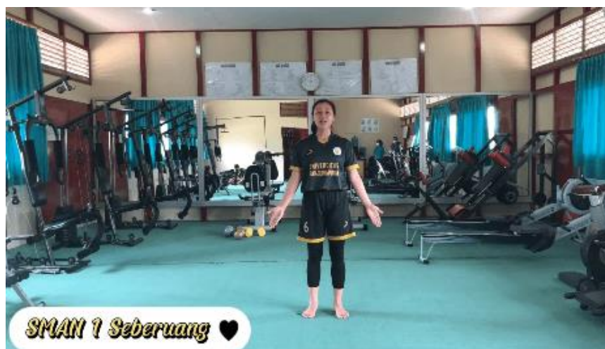
Gambar 8. Peserta menyebutkan Asal Sekolah