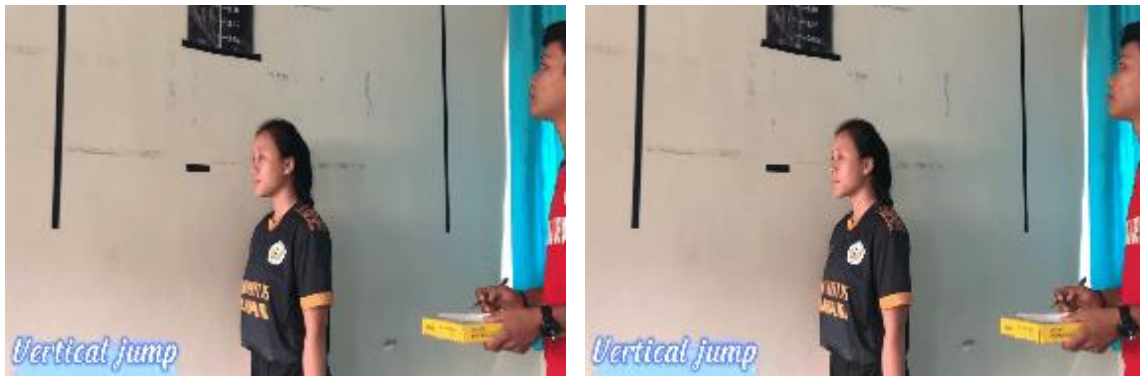
Gambar 13. Peserta bersiap dan Papan Skala