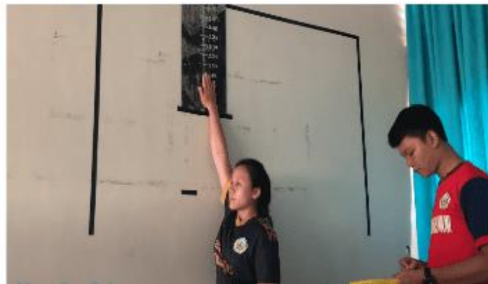
Gambar 14. Peserta bersiap untuk melompat