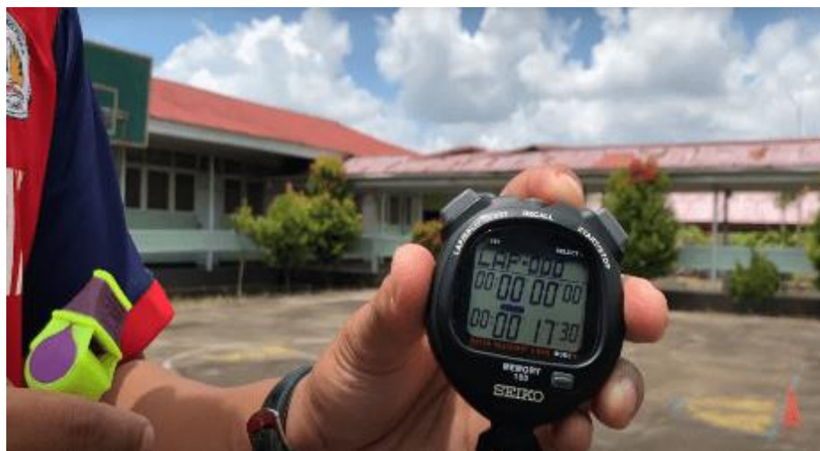
Gambar 12. Catatan Waktu Peserta melakukan Tes Illinois Agility