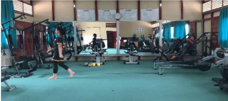
Gambar 4. Calon mahasiswa berjalan ke kiri dan ke kanan dan ke depan

Pemateri menyampaikan isi dalam portofolio, yang dimulai dari berjalan ke kanan dan ke kiri lalu peserta berjalan menuju ke depan kamera, peserta di harapkan berjalan seperti biasanya dengan menyesuaikan gerak sudah dicontohkan dalam video atau gambar.