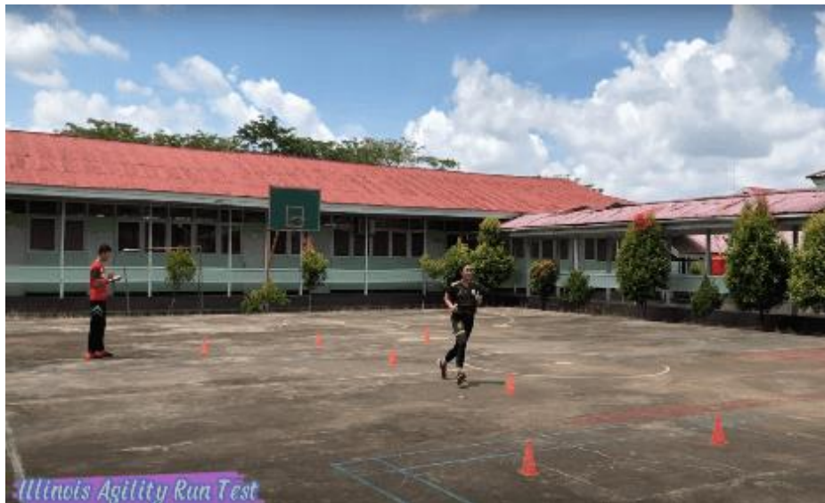
Gambar 11. Peserta melakukan Tes Illinois Agility

Subjek harus berdiri (menuju garis start). Pada perintah 'Go' stopwatch dimulai, dan peserta bangun secepat mungkin dan berlari di sekitar lapangan ke arah yang ditunjukkan, tanpa menjatuhkan kerucut, ke garis finish, di mana waktunya dihentikan.