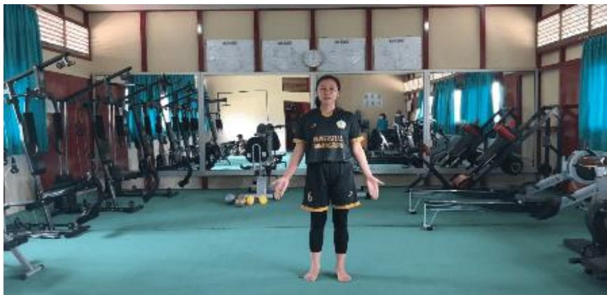
Gambar 5. Posisi peserta Saat di depan kamera/video

Setelah itu, peserta secara otomatis menyebutkan dan menjelaskan nama lengkap peserta, tempat tanggal lahir peserta dan yang terakhir, peserta menyebutkan asal sekolah atau perwakilan dari SMA/SMK/MA peserta.