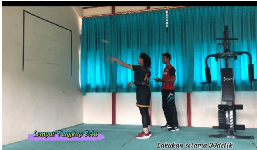
Gambar 9. Peserta melakukan Tes Lempar Tangkap Bola

Peserta melaksanakan tes keterampilan olahraga yang tes pertama adalah melakukan tes lempar tangkap bola selama 30 detik, tes dilakukan peserta saat memulai melempar menggunakan salah satu tangan yang biasa digunakan sehari-hari, misalkan tangan kanan. Setelah dilempar ke dinding dan memantul seketika itu tangan yang menangkap adalah tangan kiri dan selanjutnya lemparan dimulai dari tangan kiri dan ditangkap tangan kanan, seterusnya seperti itu bergantian melempar dan menangkap tanpa bola tenis tersebut terjatuh ke lantai dan jarak dari dinding sekitar 2 meter serta peserta diminta untuk melakukan gerakan tersebut sebanyak-banyaknya dalam waktu 30 detik.