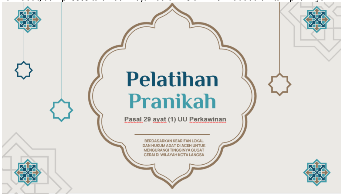
Gambar 4 Tampilan Bahan Presentasi

Islam, hukum talak dan ketentuannya, penyelesaian masalah, penyelesaian menurut hukum adat, dan proses talak dan rujuk dalam Islam. Berikut adalah tampilannya.