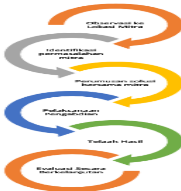
Gambar 1 Rancangan Kegiatan

Merujuk pada uraian yang telah dipaparkan sebelumnya tentang situasi mitra dan permasalahan prioritas yang dihadapi oleh mitra, ada beberapa teknis pelaksanaan untuk menghasilkan solusi bagi mitra. Tim pengusul dan mitra menyepakati bahwa dalam proses pengabdian ini yang ditargetkan adalah adanya buku panduan bimbingan pranikah bagi calon pengantin di Kota Langsa. Adapun hal-hal yang akan dilaksanakan dalam proses pengabdian yang telah disepakati oleh tim pengusul dan mitra adalah sebagai berikut.