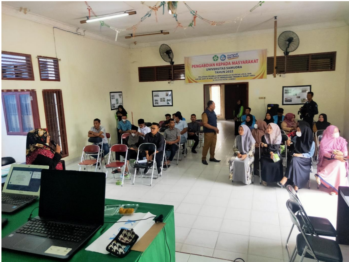
Gambar 5 Proses Pelaksanaan Pelatihan