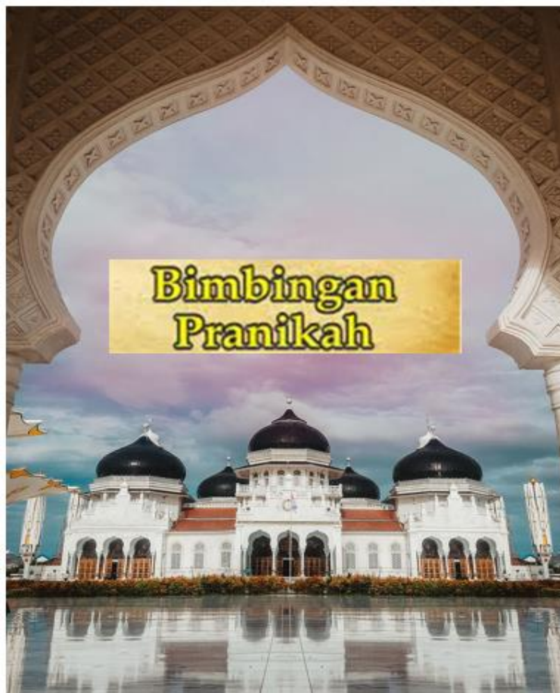
Gambar 3 Tampilan Draf Buku

Hal yang dilakukan pada tahapan perencanaan untuk langkah pertama adalah pembuatan buku pedoman pranikah. Kegiatan pembuatan buku dilakukan dengan melakukan telaah pustaka dan referensi terkait hal-hal yang berhubungan dengan proses pernikahan. Buku yang disusun memuat beberapa hal yaitu pengertian keluarga, fungsi keluarga, mahram, visi keluarga, adat pranikah dalam masyarakat Aceh, serta perihal data-data kasus perceraian dan penyebabnya di Aceh. Berikut prosesnya