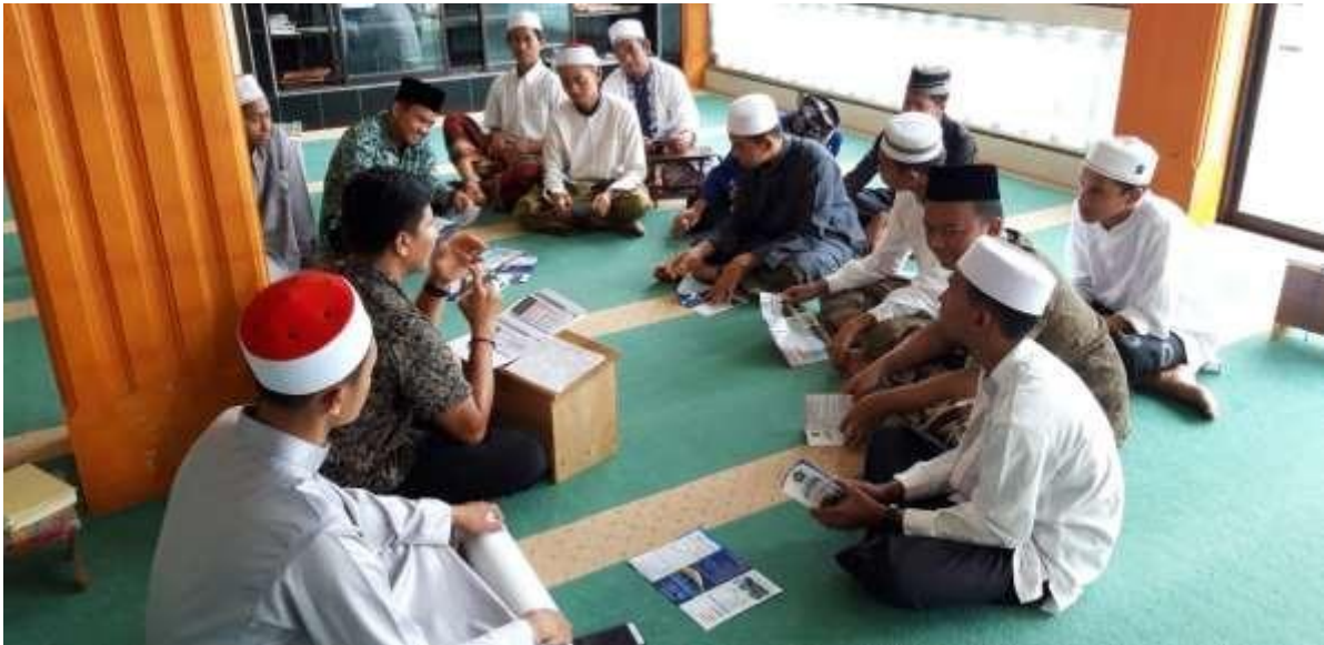
Gambar 2. Peserta Sosialisasi SNMPTN, SBMPTN, SMMPTN di MA AL-FUAD

sehingga para siswa/santri tidak menemui kesulitan untuk dapat melanjutkan keperguruan tinggi sesuai dengan program studi yang diminati.