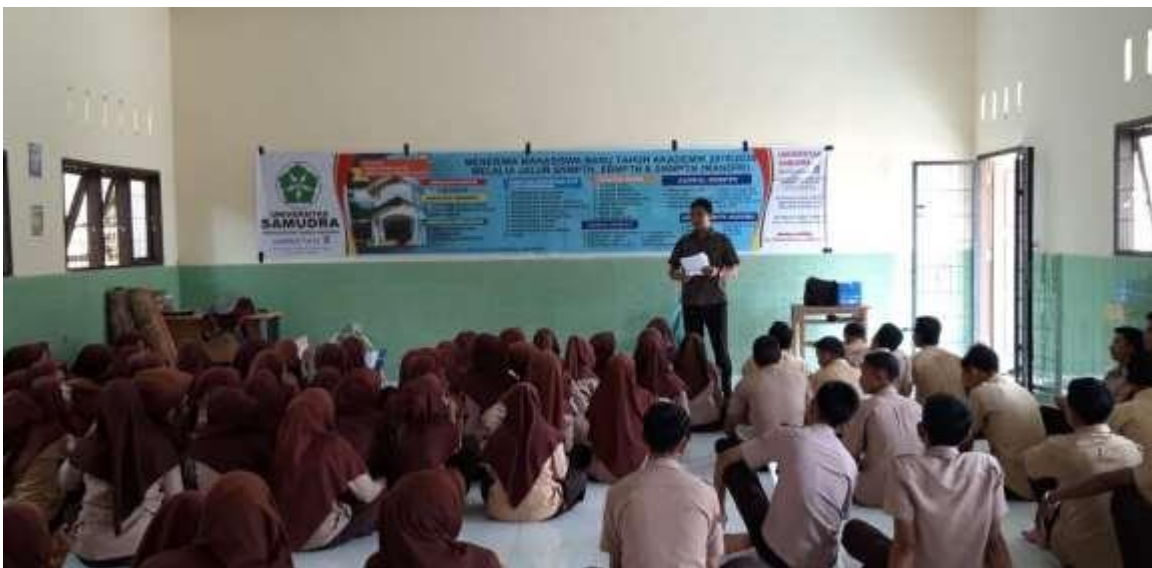
Gambar 1. Peserta Sosialisasi SNMPTN, SBMPTN, SMMPTN di SMAN 1 Seruway

sekolah berbeda dengan SNMPTN yang melalui sekolah. Harapannya dengan adanya kegiatan ini daya minat siswa-siswa SMA N 1 Seruway meningkat untuk mau melanjutkan kuliah ke perguruan tinggi. Selain kendala diatas siswa juga masih bingung dalam menentukan jurusan prodi apa saja yang sesuai minatnya dan juga universitas mana saja yang memiliki peluang yang besar untuk dilamar sehingga mereka dapat diterima di perguruan tinggi negeri. Dari berbagai pertanyaan ini TIM pengabdian melakukan FGD lanjutan sehingga setiap problema dari siswa dapat terjawab.