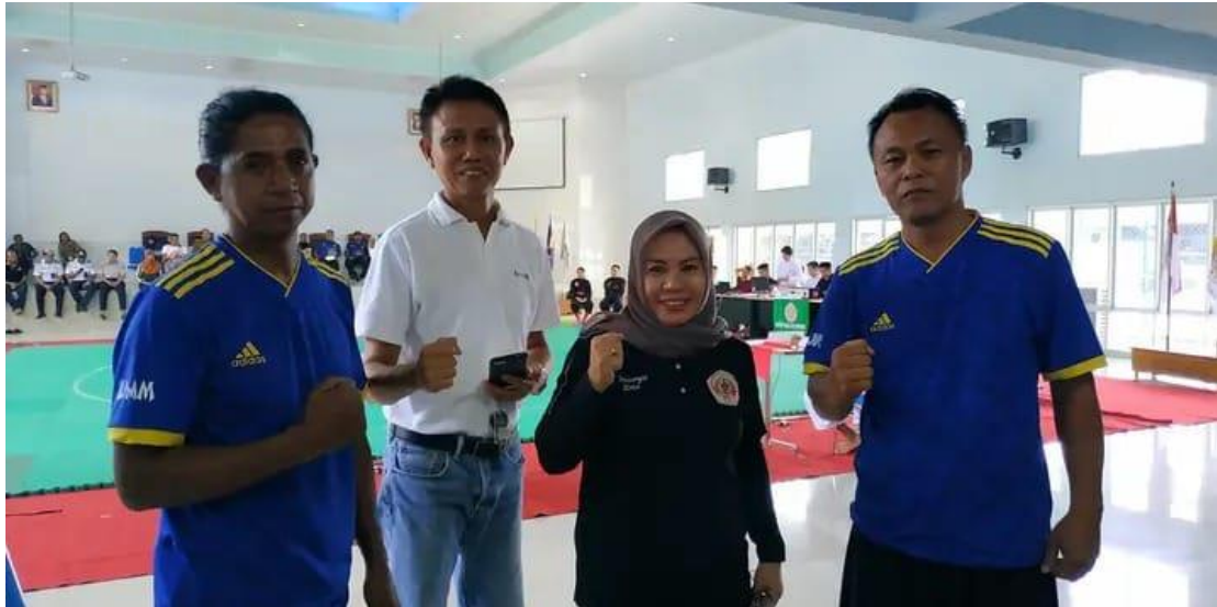
Gambar 4. Photo bersama Ketua IPSI, dan para Pelatih, ditengah tengah seleksi penentuan atlet Pencak Silat Kota Kotamobagu persiapan Proprov 2025