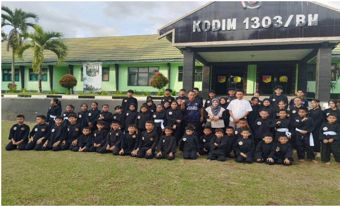
Gambar 2. Photo bersama Ketua IPSI, Pelatih, dan atlet-atlet Pencak Silat Kota kotamobagu