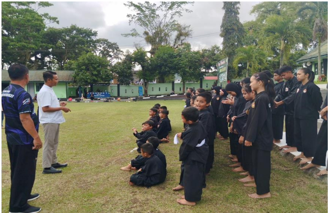
Gambar 3. Sedang mmemberikan pengarahan kepada atlet-atlet Pencak Silat Kota Kotamobagu didampingi oleh pelatih