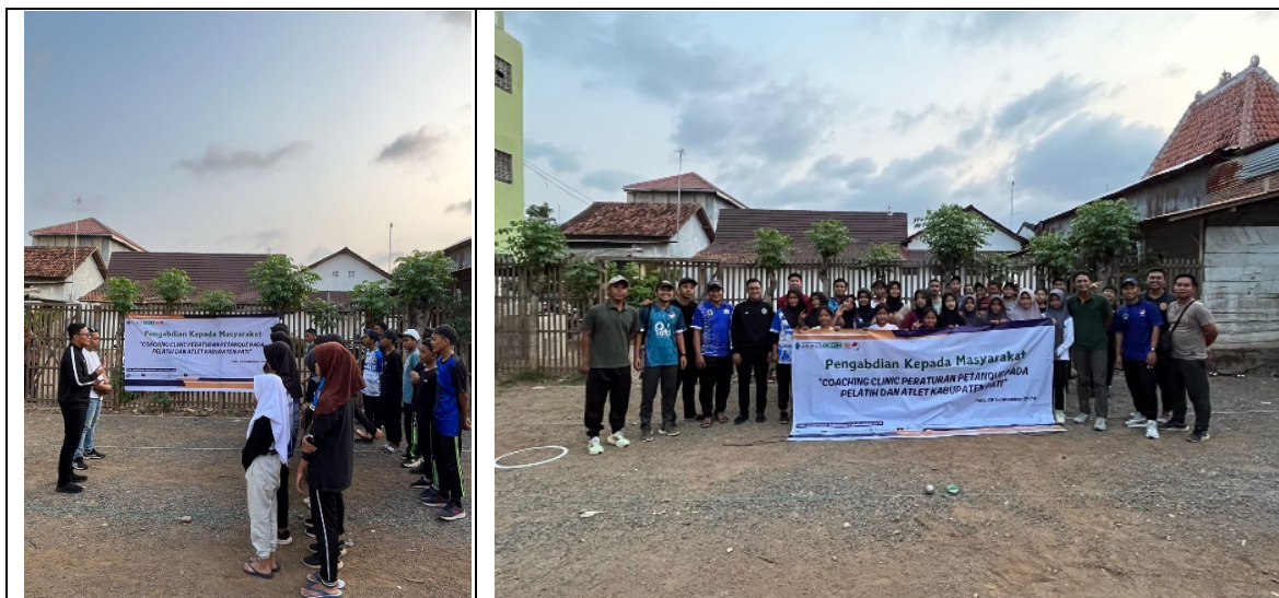
Gambar 3. Evaluasi dan Tindak Lanjut

Pada tahap evaluasi dan tindak lanjut dilakukan selama tahap pelaksanaan pengabdian erlangsung. Hal ini bertujuan untuk mengetahui progres kemajuan pengetahuan, pemahaman, dan keterampilan setiap atlet dan pelatih/ official terhadap peraturan pertandingan olahraga petanque. Selain itu, peneliti melakukan post-test hasil akhir pelaksanaan serta tingkat kepuasan setelah dilakukannya kegiatan coaching clinic .