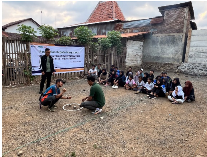
Gambar 2. Pelaksanaan Coaching Clinic

petanque; b) memberikan coaching clinic berupa sosialisai dan edukasi terkait peraturan pertandingan olahraga petanque; c) memberikan coaching clinic berupa pelaksanaan keterampilan terkait peraturan pertandingan olahraga petanque.