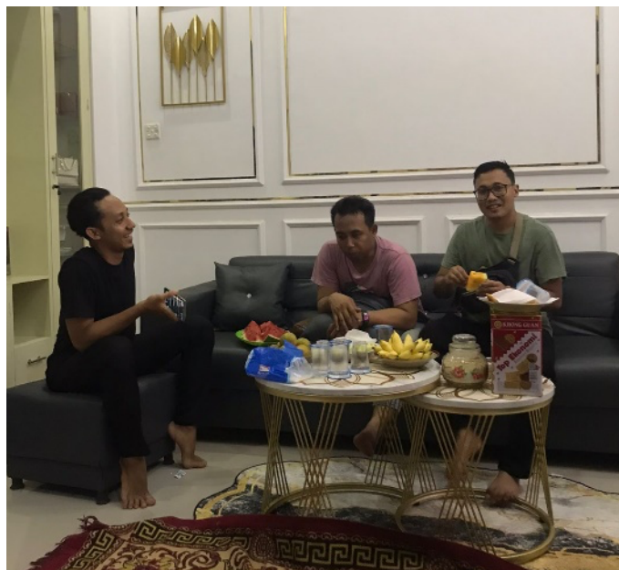
Gambar 1. Perencanaan Program Kegiatan

Pada tahap ini langkah-langkah yang dilakukan yaitu melakukan koordinasi dan komunikasi dengan sampel/mitra terkait perencanaan program kegiatan seperti; tempat, peralatan, sumber daya manusia, tenaga ahli, buku panduan materi, dan kuesioner.