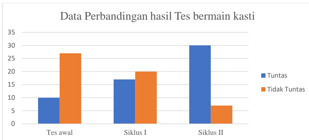
Gambar 5. Perbandingan Ketuntasan Hasil Belajar Murid Setiap Siklus

Sedangkan pada siklus I hasil belajar bermain kasti peserta didik secara keseluruhan masih mencapai 54,05%. Kemudian pada siklus II berdasarkan hasil refleksi ternyata membawa peningkatan menjadi 81,08 %.