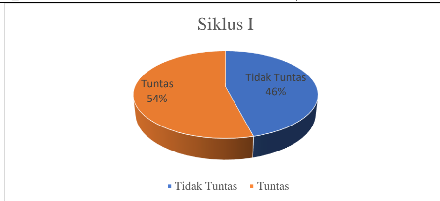
Gambar 2. Deskripsi Hasil Belajar Siklus I bermain kasti