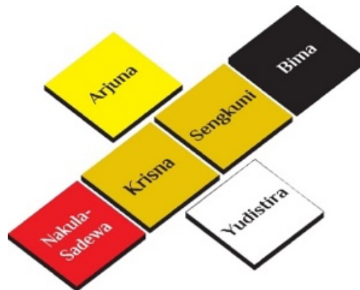
Gambar 2. Bentuk dan Warna Base

Ukuran base adalah 45 cm x 25 cm. Warna-warni di base mewakili karakter dari setiap tokoh yang tergambar mewakili karakter saudara 4, 5 “ pancer ” atau karakter manusia. Ada 4 karakter manusia, yaitu merah simbol kemarahan, putih simbol kesucian, hitam simbol kejahatan, dan kuning simbol keakuan atau pengandalan kemampuan diri sendiri.