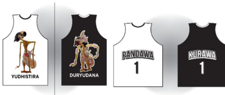
Gambar 4. Rompi/Seragam