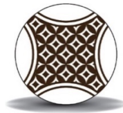
Gambar 3. Bola

Bola berukuran 4 seperti bola untuk permainan sepak bola anak-anak, gambar motif batik yang dipilih penulis adalah motif batik kawung. Permukaan bola ini halus dan tidak keras sehingga aman untuk remaja, untuk tekanan angin disesuaikan dengan kebutuhan dan kesukaan pemain. Motif kawung dipilih penulis untuk dimasukkan sebagai hiasan dalam bola karena penulis melihat nenek moyang dahulu memilih motif kawung berharap orang yang memakainya akan bisa berguna bagi sesama dimana pun berada.